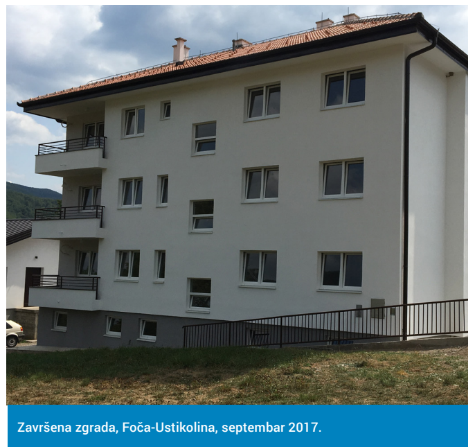
Završena zgrada, Foča-Ustikolina, septembar 2017.